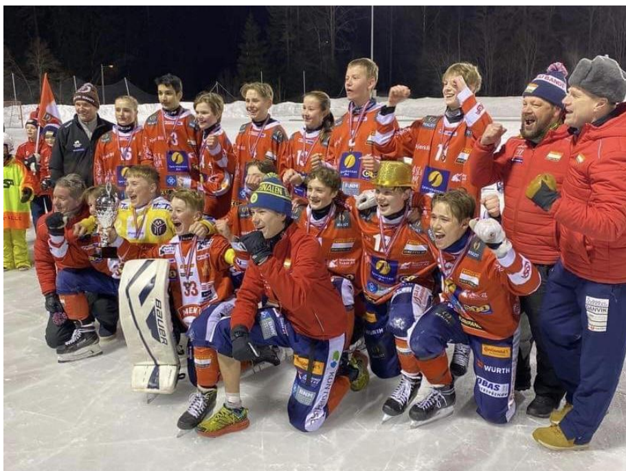
Samarbeidslaget KIL/MIF ble norgesmestere smågutt 2023 etter seier 3-2 over Stabæk.

Vi gratulerer samarbeidslaget Konnerud/Mjøndalen som ble norgesmestere i smågutt 2022-2023! Vi hadde denne sesongen lag i NM for Jr., gutt og smågutt. Alle lagene nådde målet om kvartfinale.